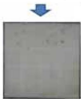
他社水溶性離型剤