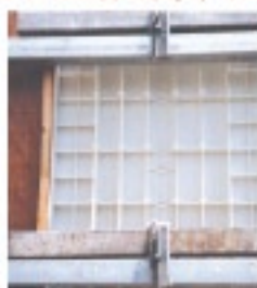
関西版7サイズ（リブ高さ70mm）