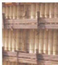
名古屋版4サイズ（リブ高さ70mm）