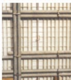
関東版7サイズ（リブ高さ60mm）

3タイプ：関東版（7サイズ）・関西版（7サイズ）・名古屋版（4サイズ） 自由に組み合わせて、連結も簡単に出来ます