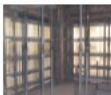
明るく安全な構体内部