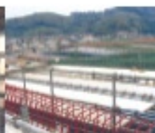
高速道路高架橋工事