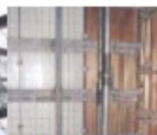
合板との張り合い