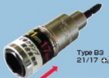
Type B3 21/17 ⚙️