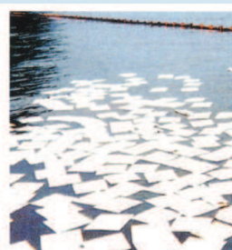
河川・海洋汚染防止