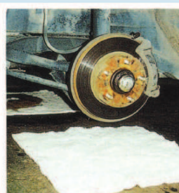
プレーキドラム交換