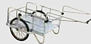
ハンディキャンパー H-III