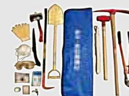
レスキューバッグ