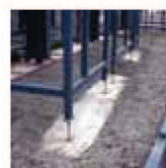
土間部分の間柱受