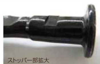
ストッパー部拡大

インパクトドライバー等による 締め過ぎを防止します。 こんな経験はありませんか? ※ホントイの締め過ぎで丸セパレーターの カップがコンパネに食い込んでしまう。 ※樹脂型枠に傷が付いてしまう。