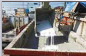
②本商品を泥土に添加し、バックホウで十分に混合