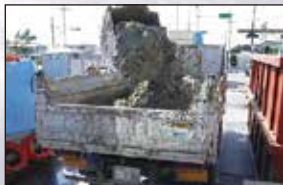
③泥土の性状が改質したら、処理土をダンプトラックへ積み込み