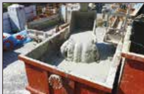
①現場で発生した高含水泥土をピットに投入